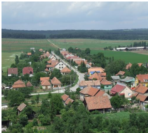
Kistelepülések 2000 fő alatti lakosság