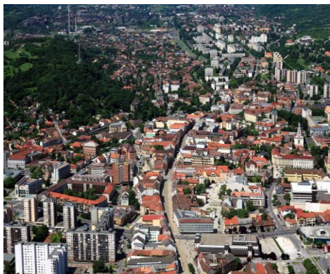
Nagyméretű települések 20.000 fő feletti lakosság